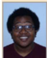
Godys Y KDLAT Médiateur multimédia en service civique