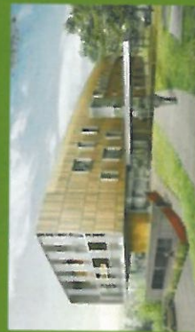
Ne pas voir sur la voie publique. Repère: Serrigère.com

Tel. : 02 99 71 12 13 Email : clic@pays-redon.fr